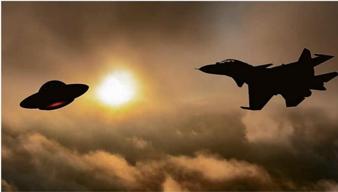
NUEVO INFORME DEL PENTÁGONO REVELA INCIDENTES CON OVNIS QUE NO TIENEN EXPLICACIÓN.