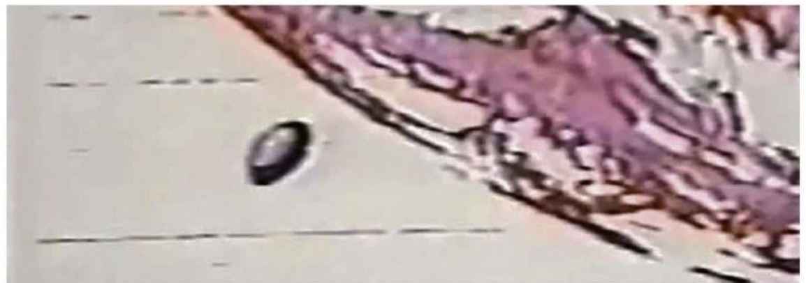
NUEVO INFORME DEL PENTÁGONO REVELA INCIDENTES CON OVNIS QUE NO TIENEN EXPLICACIÓN.

2023 se habla de formas de vida no humanas y de tecnologías no humanas. En este sentido, el lenguaje es fundamental para ir analizando de manera muy precisa la forma en que se trata de introducir conceptos para dar a conocer alguna información relevante.