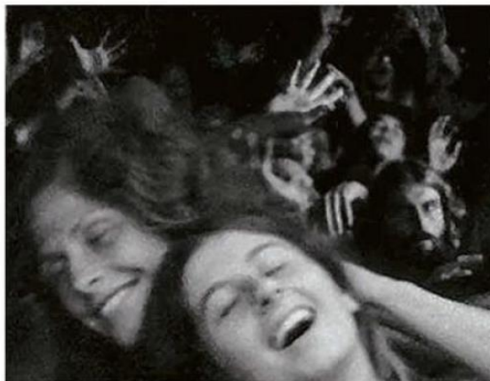
EN LAS SECTAS ES FRECUENTE VER CASOS DE HISTERISMO COLECTIVO.