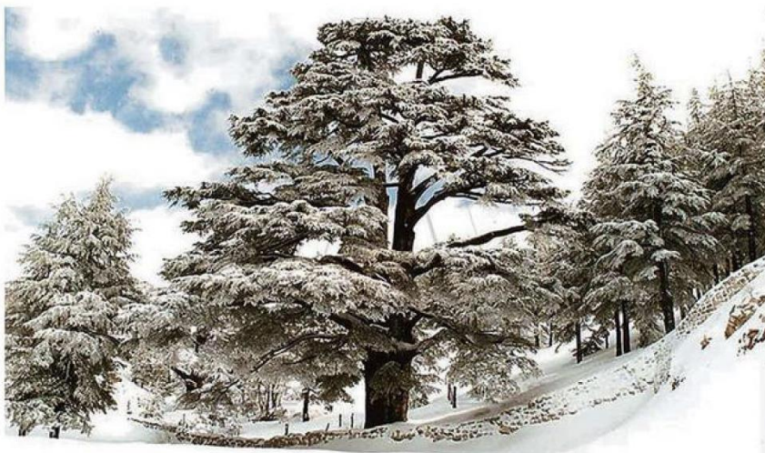
EL CEDRO ES EL SÍMBOLO DEL LÍBANO, ESTÁ EN SU BANDERA, CRECE EN LAS MONTAÑAS DONDE EXISTEN EJEMPLARES DE MÁS DE DOS MIL AÑOS DE ANTIGÜEDAD.

En los últimos años el país del cedro ha sufrido una guerra civil que se extendió por 15 largos años y ha sido atacado cinco veces por el Ejército de Israel. A Chile los libaneses llegaron desde el siglo XIX.