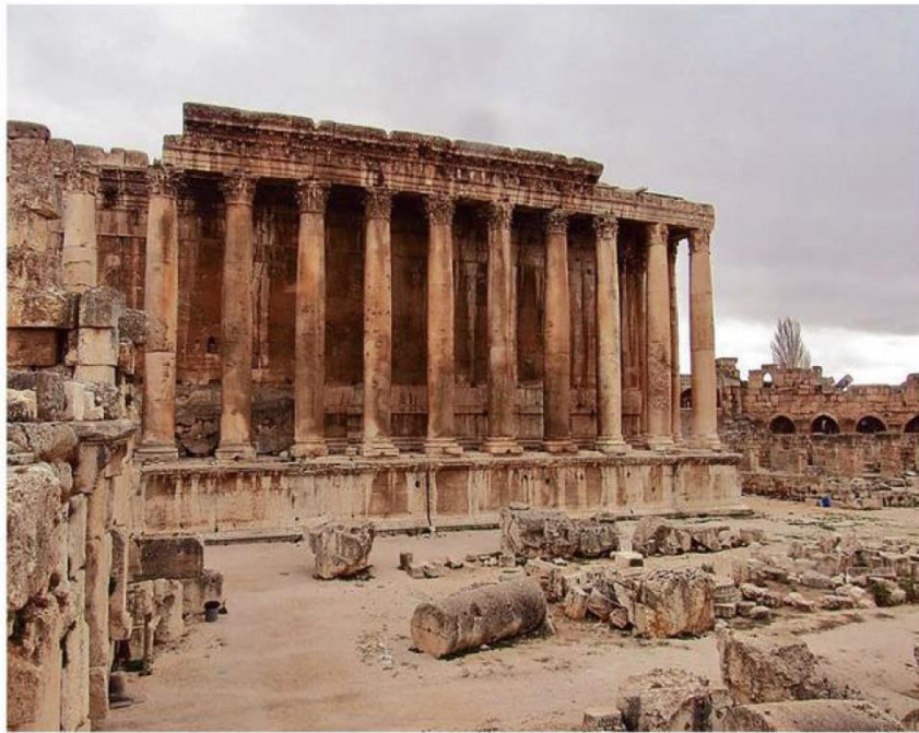
LAS RUINAS DE BAALBEK SON UN ENIGMA. SUS BLOQUES DE PIEDRA SON DE UN TAMAÑO Y PESO MUCHO MAYORES QUE CUALQUIERA UTILIZADA EN CONSTRUCCIONES ANTIGUAS.

-Los primeros inmigrantes libaneses llegaron