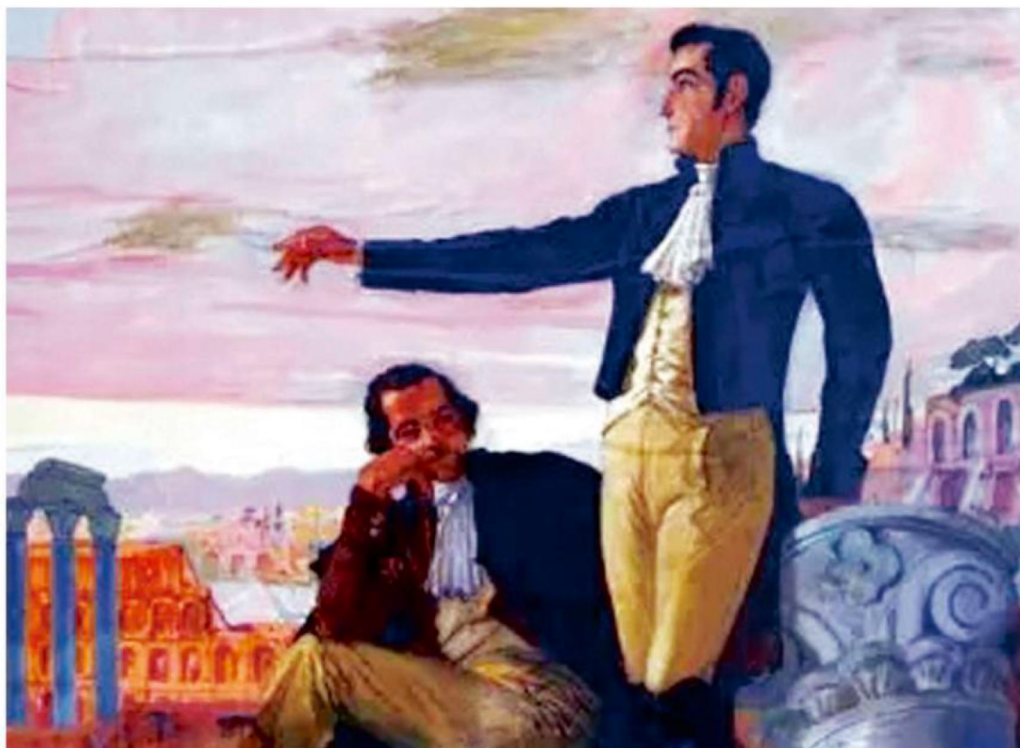
JURAMENTO DE SIMÓN BOLÍVAR EN EL MONTE SACRO, EN ROMA, TENIENDO COMO TESTIGO A SU MAESTRO SIMÓN RODRÍGUEZ.

Sin embargo, el insigne humanista tuvo diversas anécdotas que muestran un aspecto sugestivo de su vida. Se cuenta que su esposa lo habría encontrado en malos pasos con una sirvienta y le habría dicho: "¡Andrés, estoy sorprendida!". Como buen gramático, don Andrés le