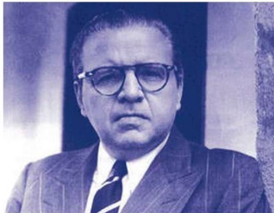
MARIANO PICÓN SALAS, ESTUDIÓ EN EL INSTITUTO PEDAGÓGICO CHILENO Y SE DESTACÓ POSTERIORMENTE, COMO ESCRITOR, DIPLOMÁTICO Y ACADÉMICO VENEZOLANO.