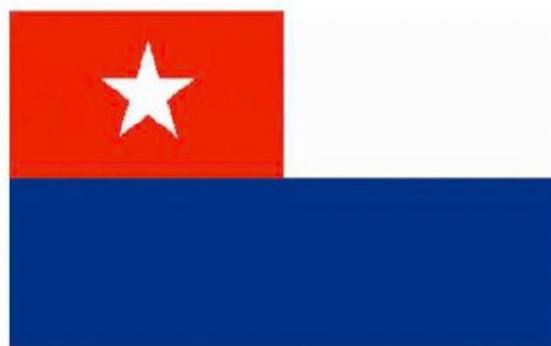
PRIMITIVA BANDERA DE CUBA, DEL AÑO 1868, SIMILAR A LA DE CHILE, CON LOS COLORES INVERTIDOS.

anterior, durante el siglo XIX bajo el contexto de la Guerra contra España en 1865, el gobierno chileno envía como agente diplomático a Estados Unidos a Benjamín Vicuña Mackenna con la misión de generar lazos y apoyo para la independencia de Cuba en desmedro de España. Es por ello que una vez llegado a Estados Unidos se puso en contacto