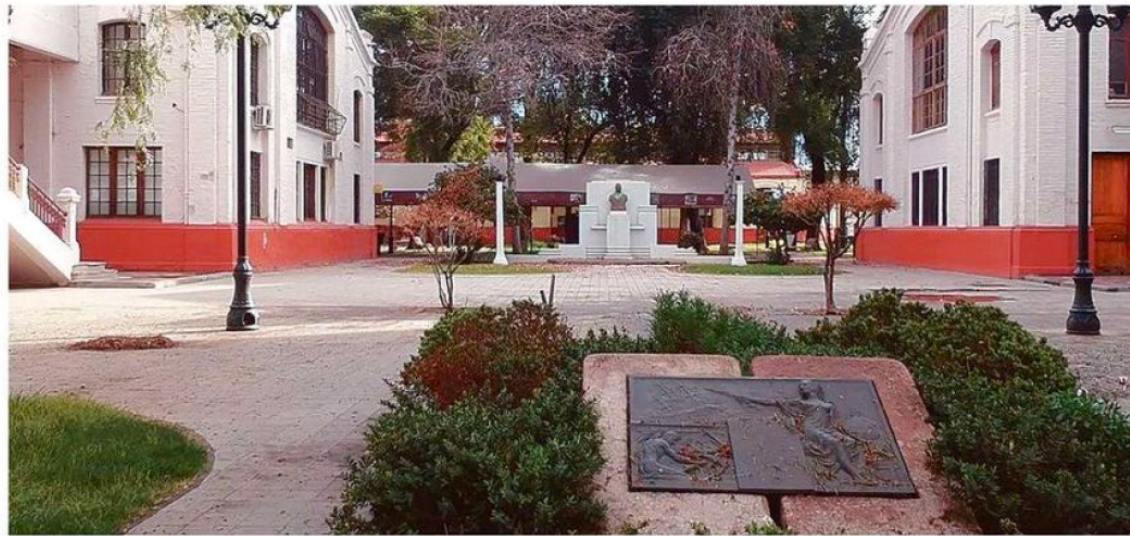
PATIO DE LA ESCUELA DE ARTES Y OFICIOS FUNDADA EN 1849.

-La Universidad de Santiago no es una universidad de conflictos. Esa es una imagen construida históricamente por algunos medios de comunicación. Lo que ocurre es que