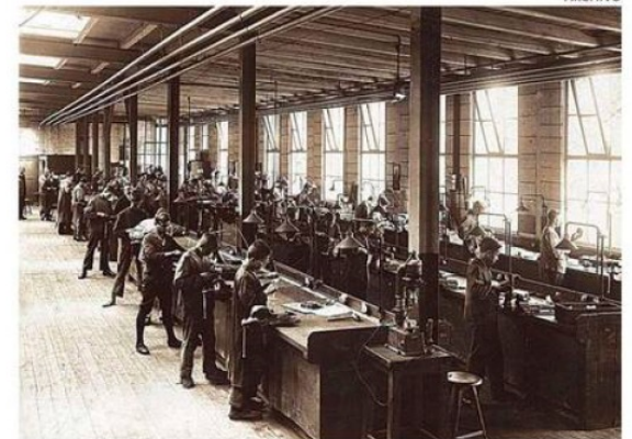
ALUMNOS DE LA ESCUELA DE ARTES Y OFICIOS.