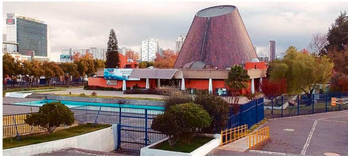
PLANETARIO DE LA USACH, POR SU CÚPULA DE VEINTE METROS DE DIÁMETRO, ES UNO DE LOS MAYORES PLANETARIOS DEL PLANETA.