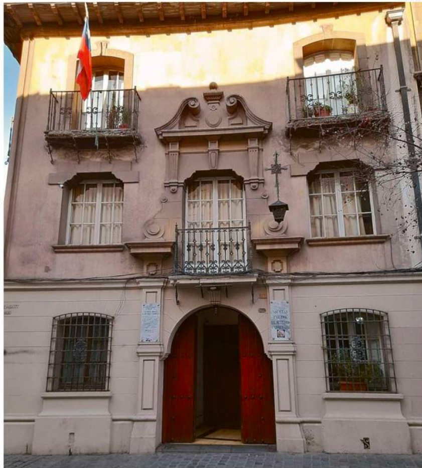
EN EL TRADICIONAL BARRIO PARÍS-LONDRES, EN SANTIAGO, SE ENCUENTRA LA SEDE DE LA SOCIEDAD CHILENA DE HISTORIAS Y GEOGRAFÍA.

-Respecto a lo afirmado por el expresidente Piñera que su gobierno sufrió "un golpe de Estado no tradicional", creo que no cabe llamarlo así, toda vez que a lo más podría hablarse "de intento de gol-