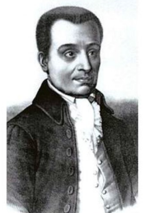
EL PRÓCER JUAN MARTÍNEZ DE ROZAS, MIEMBRO DE LA PRIMERA JUNTA DE GOBIERNO, NACIÓ EN MENDOZA, CUANDO ESTA CIUDAD AUN PERTENECÍA AL REINO DE CHILE.

-¿Qué nos puede decir respecto a las Jornadas Históricas que culminan hoy día?