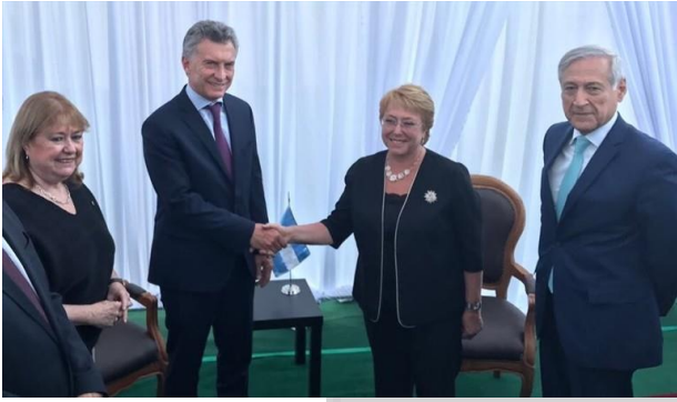
Presidentes Michelle Bachelet y Mauricio Macri conmemoran el bicentenario de la Batalla de Chacabuco que significó el gran paso para la independencia de nuestro país.

de san Martín y O Higgins derrotaron a los realistas después de haber recién atravesado los Andes, por altitudes cercanas a los 5.000 metros de altitud ,no alcanzaron ni a descansar porque los españoles presentaron combate a solo unos días del arribo de las extenuadas tropas al valle de Putaendo (Sector San Felipe-Los Andes).El éxito fue resonante y los realistas se retiran al sur de Chile, especialmente Concepción, Valdivia y Chiloé. A su vez O Higgins asume el gobierno demostrando sus dotes de Estadista organizando y poniendo en