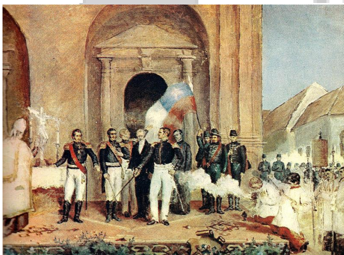
Don Bernardo O'Higgins, Miguel Zañartu, Hipólito de Villegas, José Ignacio Zenteno, juran la Independencia Chile, en la plaza de armas de Talca 12 febrero 1818