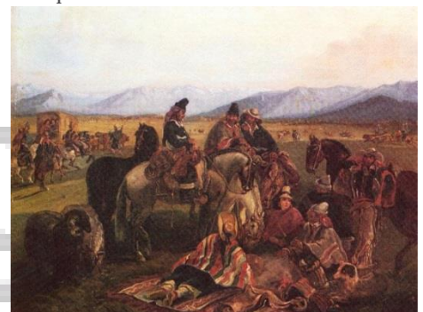
Rodeo de huasos maulinos

nuestro verano e invierno europeo que remató a elevadísimos precios cuadros del pintor alemán que visitó el Chile Colonial y luego Republicano Juan Mauricio Rugendas obras de hacia 1834. Interesante porque Rugendas en Chile pintó obras relacionadas costumbres, paisajes y personajes chilenos. Señala Christies que las obras subastadas fueron: “Huasos Maulinos”, El Rapto (El Malón Araucano) y Playa el Membrillo de Valparaíso. Los dos primeros cuadros se los adjudicaron inversionistas chilenos, el último quedó en Europa. Rugendas pintó también la realidad Limeña, por vivir un tiempo en Perú, con cotizados óleos.