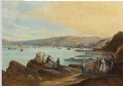
The beach of El Membrillo, Valparaíso traces

Una información miscelánea más que efeméride, pero que es relevante porque se relaciona con los inicios de nuestra República: La prestigiosa casa Christies de Londres, comunicó durante