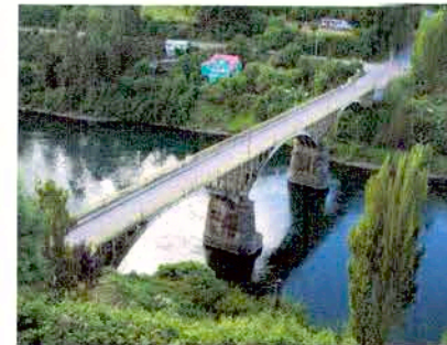
Fotografías del Puente Carlos Ibáñez del Campo