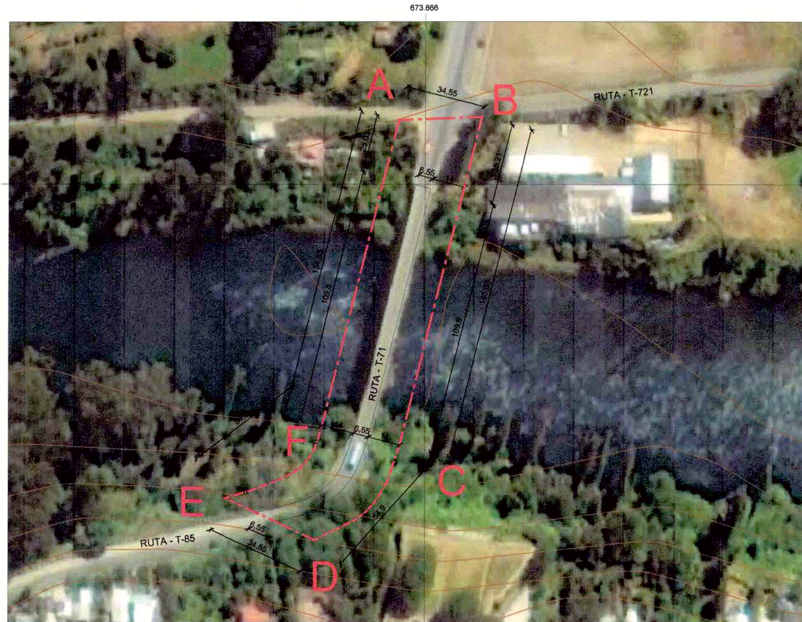
PLANO DE LÍMITES ESCALA GRÁFICA